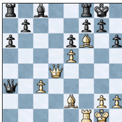
Posición tras 22. Qxd4

En esta posición Radjabov realiza un espectacular sacrificio que abre el expuesto enroque negro. 19.Cf6+! Cxf6 [19...gxf6? 20.exf6 amenazando Dxh6 20...Rh7 21.Ad3+ ganando] 20.Axf6 Cxd4 21.Txd4! Axd4 22.Dxd4