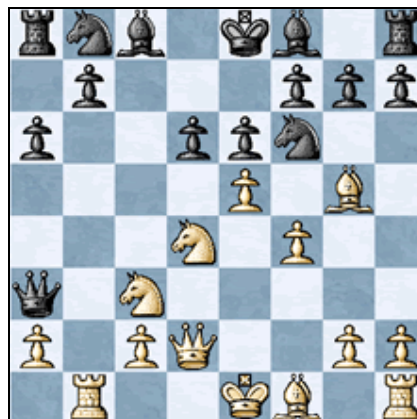
Posición tras 10. e5

1.e4 c5 2.Cf3 d6 3.d4 cxd4 4.Cxd4 Cf6 5.Cc3 a6 6.Ag5 e6 7.f4 Db6 8.Dd2 Dxb2 9.Tb1 Da3 10.e5 [Esta es la antigua línea, que había sido abandonada en favor de 10.f5 pero Radjabov derrotó de forma espectacular con esta jugada, en una reciente partida del Mundial de Rápidas]