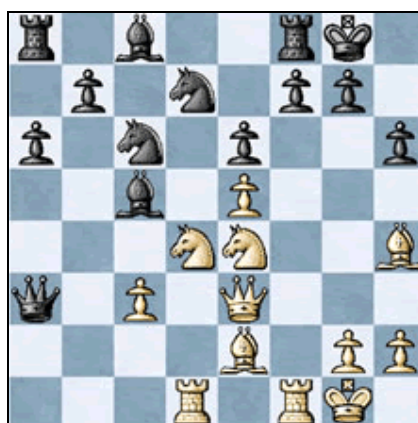
Posición tras 18.0-0 0-0