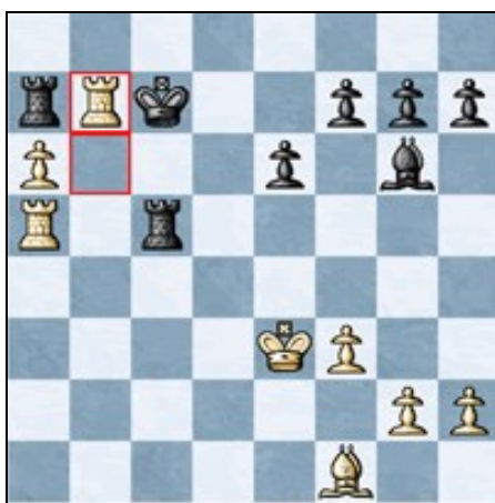
¡Una posición para la historia!

26. c4 Tc6 27. Cxc5 Txc5 28. Txa6 Tb8 29. Td1 Tb2 30. Ta7+ Rf6 31. Ta1 Tf5 32. f3 Te5 33. Ta3 Tc2 34. Tb3 Ta5 35. a4 Re7 36. Tb5 Ta7 37. a5 Rd6 38. a6 Rc7 39. c5 Tc3 40. Taa5 Tc1 41. Tb3 Rc6 42. Tb6+ Rc7 43. Rf2 Tc2 44. Re3 Txc5 45. Tb7+ 1-0